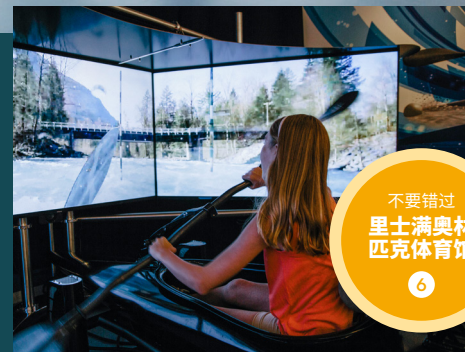
不要错过 里士满奥林匹克体育馆

接下来的下午时光不妨前往当地最受欢迎的游乐场新地郊野公园 ① (Terra Nova Rural Park) 推荐停留时间: 2-3小时。